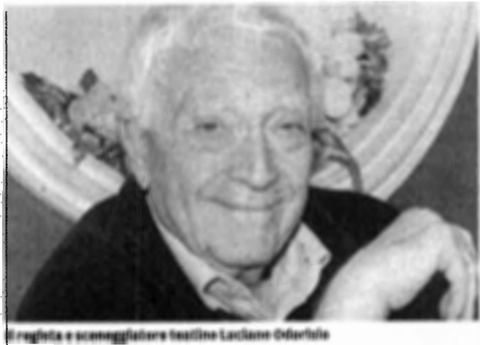
Regista e sceneggiatore teatino Luciano Odorisio