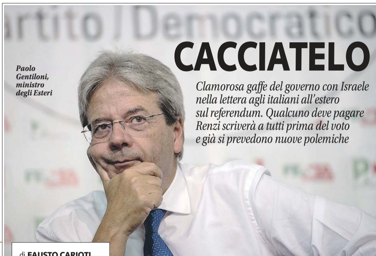
Paolo Gentiloni, ministro degli Esteri