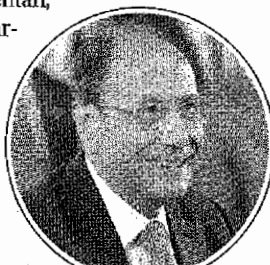
R. Schifani (Olycom)