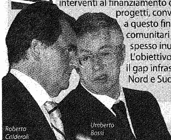
Roberto Calderoli Umberto Bossi

Verranno premiati gli amministratori virtuosi e puniti quelli inefficienti. Chi sbaglia paga. Se la Corte dei Conti riconosce un politico responsabile del dissesto finanziario di un ente locale, quel politico sarà dichiarato ineleggibile per 10 anni. Inoltre, il governatore che non rispetta i piani di rientro del deficit sanitario e che tiene al massimo l'aliquota Irpef per due anni consecutivi sarà punito con un taglio del 30% del finanziamento pubblico al suo partito.